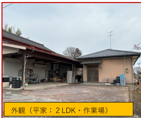
外観(平家:2LDK・作業場)